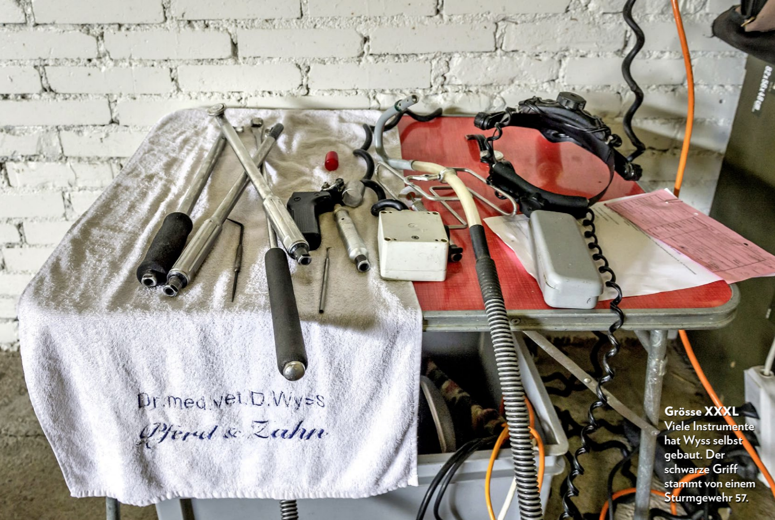
Grösse XXXL Viele Instrumente hat Wyss selbst gebaut. Der schwarze Griff stammt von einem Sturmgewehr 57.